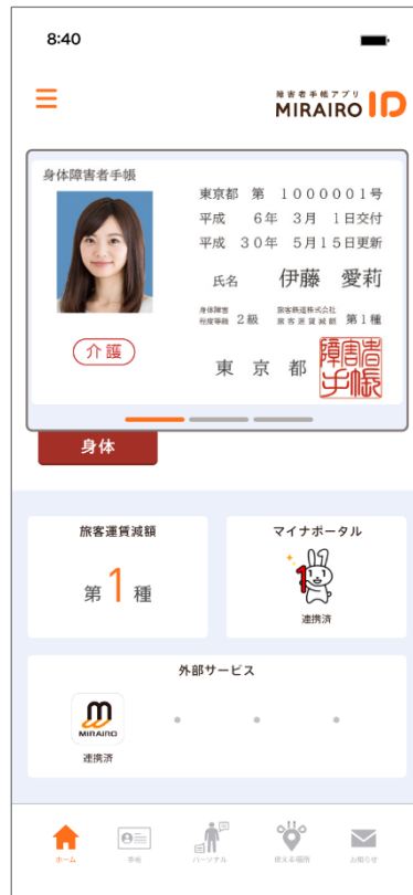
「ミライロID」イメージ